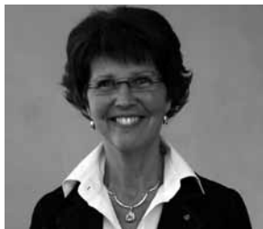
YVONNE ANDERSSON RIKS- DAGSLEDAMOT

Slutligen och inte minst vill också jag uppmärksamma alla läsare på att kristdemokraterna var först ut med ett bra valmanifest inför EU-valet. Vi har riktigt bra toppkandidater och vi har all anledning att stolta uppmana våra medborgare att deltaga i valet och medverka till att vi får bra kristdemokratiskt inflytande i europapolitiken.