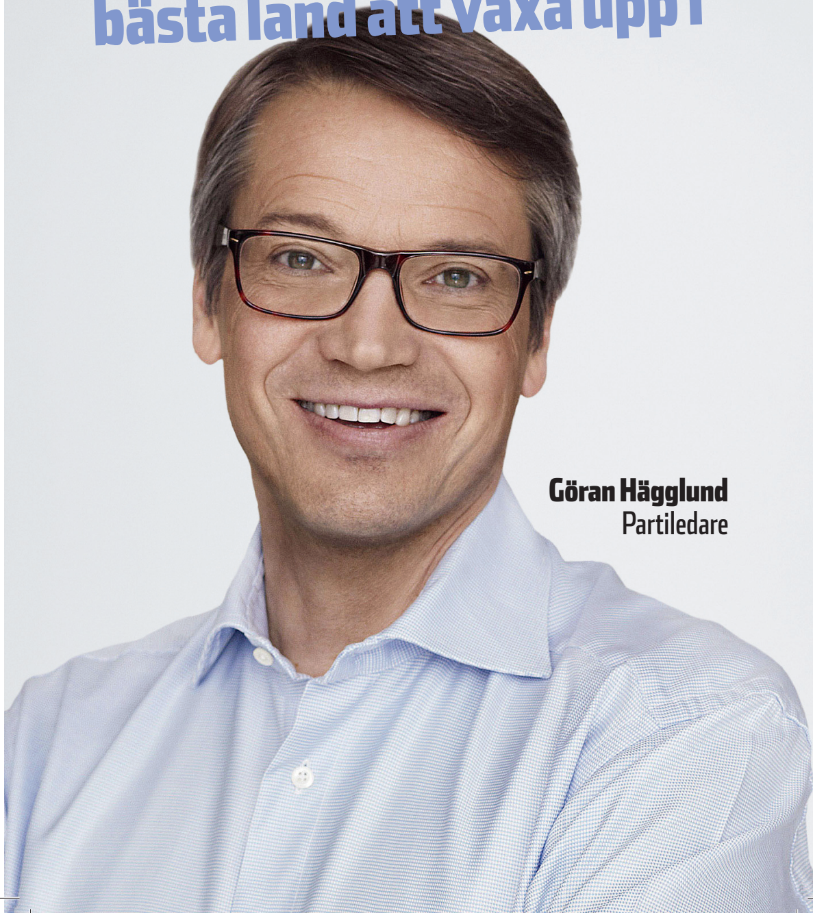
Göran Hägglund Partiledare

”Sverige ska bli världens bästa land att växa upp i”