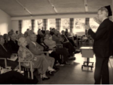
Mats Odell talar framför en fullsatt konferenslokal av intresserade kristdemokrater från hela Östergötland.