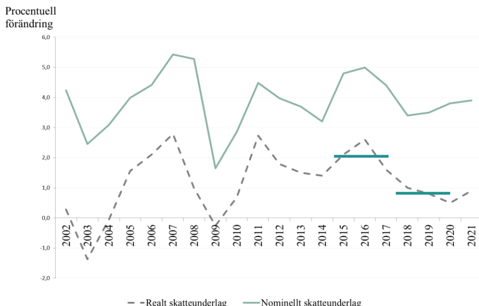
Figur 1: Skatteunderlagets utveckling i riket år 2002-2016 med prognos till och med år 2021. Helt dragen linje visar genomsnittligt reallt skatteunderlag 2015-2017 och 2018-2020.

Av figur 1 framgår att skatteunderlaget har en väsentligt lägre real utvecklingstakt under kommande år jämfört med närmast föregående treårsperiod. Från en nivå omkring 2 procent per år bedöms nu skatteunderlagsutvecklingen sjunka till under 1 procent per år. 1