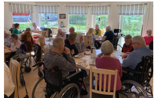
Invigningen av Söderhörnet

Målet är att det ska finnas en sådan mötesplats i alla tätorter. Ett ytterligare steg i denna utökade satsning är att en mötesplats öppnats i