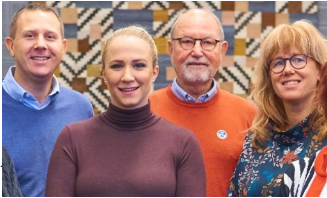
De nya ordförandena i kommunens företag