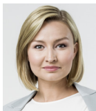
Ebba Busch Thor, partiledare KD

Vi vill att 2018 blir ett år av förändring. Ett år när svenska folket väljer en ny regering. Ett år när vi påbörjar arbetet för en välfärd man kan lita på. Så att det finns en bädd åt alla sjuka. En hand för alla de som behöver omsorg. Och en samhällsgemenskap som inte lämnar någon utanför. Det är när vi är som svagast som välfärden måste vara som starkast. Du ska kunna lita på Sverige.