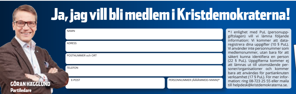
Konstruktion: Text & Bild Lars Frändstyh