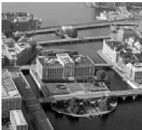
Riksdagen står inför ett svårt beslut. Ska man lyssna på folket eller ska man följa aktuella trender . . .

DET ÄR FÖRVÄNANDE att Centerpartiet går i täten för att genomdriva könsneutral äktenkskaplagstiftning. Utöver dem har företrädare för fp, s, mp och v skrivit under yrkanden om detta som Riksdagens Lagutskott har att ta ställning till. Skälen anses vara att homosexuella diskrimineras genom att de inte får kallas äkta makar och att de inte får registreras i kyrkan. Jag förstår inte varför man skulle diskrimineras för att olika samlevnadsformer benämns olika. I själva verket diskrimineras de som gifter sig genom att de betalar mer skatt än om de valde en annan samlevnadsform. Denna diskriminering borde åtgärdas i första hand. Självklart ska ingen betala mer skatt för att de gifter sig!