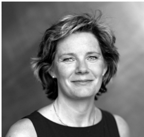
Maria Larsson presenterade Kristdemokraternas nya familjepolitiska program och blev föremål för budkavle.