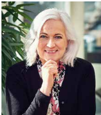
Acko Ankarberg Johansson, KD, sjukvårdsminister.

– Vi har även tagit första steget mot en nationell vårdförmedling. Jag är även väldigt stolt över att vi påbörjat arbetet med att uppdatera den svenska cancerstrategin och att vi dubblar satsningen på cancer i årets budget.