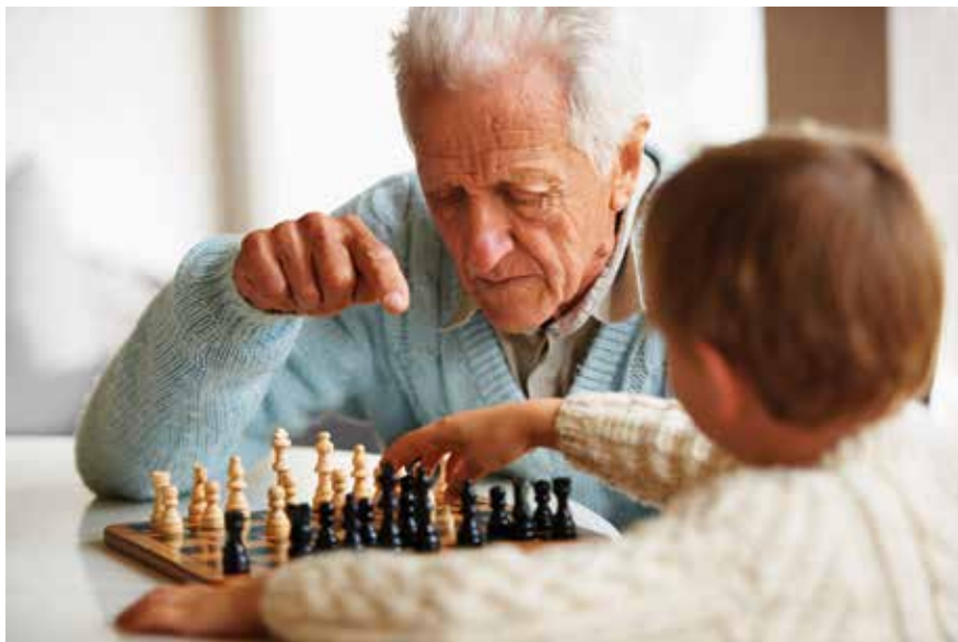
Äldres engagemang i barn och unga är ovärderligt. Goda värderingar förs vidare.