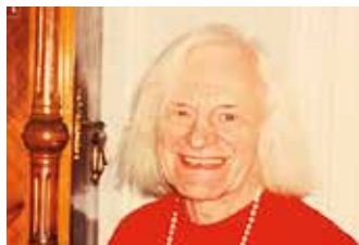
Charlotte von Mahlsdorf var mycket omtyckt i Porla med omnejd under sin tid på orten. Nu visas pjäsen om hennes liv.

– Hon bjöd in mig till museet om sitt eget liv och jag förstod direkt att det skulle kunna bli en bra dramatik kring henne. I tre år reste jag till Berlin för att intervjuer och när hon flyttat till Porla brevväxlade vi. Jag förstod då att hennes historia var mer komplicerad än jag trott. Med ett underlag på 500 sidor började jag misströsta att jag någonsin skulle få till en pjäs om henne.