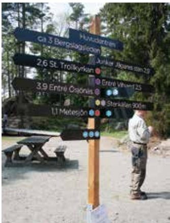
Marknadsföringsinsatser gav fler besökare i Tiveden.