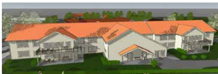
Så ter sig den nya tillbyggda Ramundergården när den står klar om ett år. Kommunens nya särskilda äldreboende innebär 32 fler platser. Här byggs också ett centralkök.