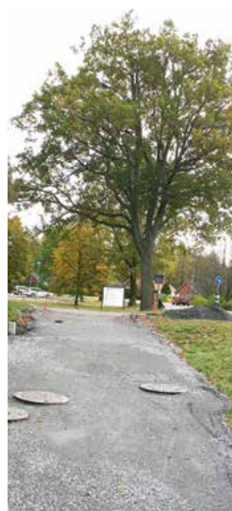
Pågår: Anläggning av gång- och cykelbana till vårdcentralen i Laxå.