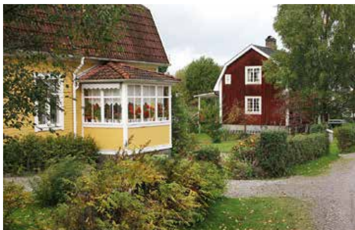
I Hasselfors bor nästan alla i villa.

Möjlighet till byggnation av nya bostäder är efterfrågad. Det skulle få till följd en