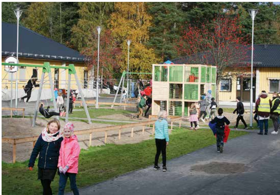
Saltängens skola har åtgärdats i flera steg, slöjdsalar, matsal, toaletter och gymnastiksal har renoverats och under sommarlovet fick eleverna en ny skolgård med lekredskap och belysning.