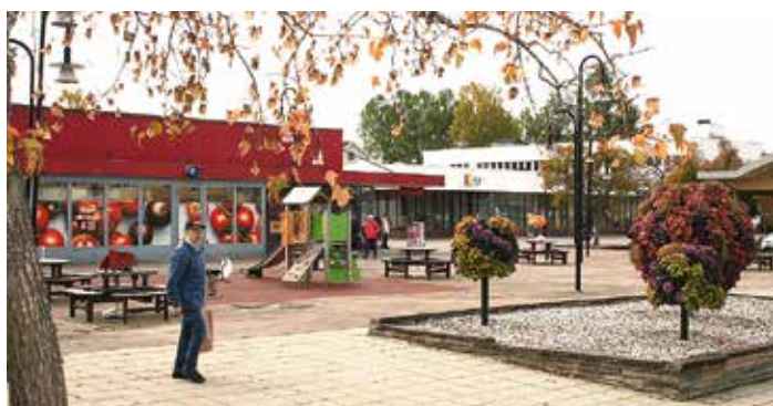
Torget i Laxå har genomgått en betydande ansiktslyftning med lekplats, blomarrangemang, picknickbord och en stensatt yta för bilparkering. Även laddstolpar och cykelställ ska installeras.