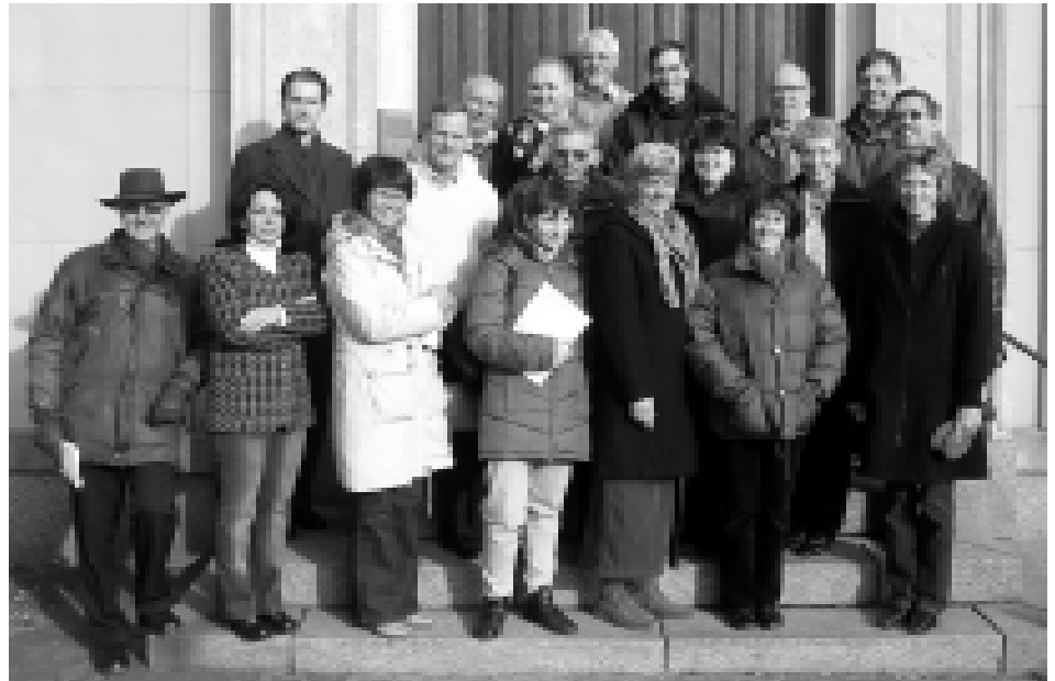
Kristdemokrater aktiva i Linköpings kommunpolitik samlade utanför stadshuset efter en utbildningsdag.