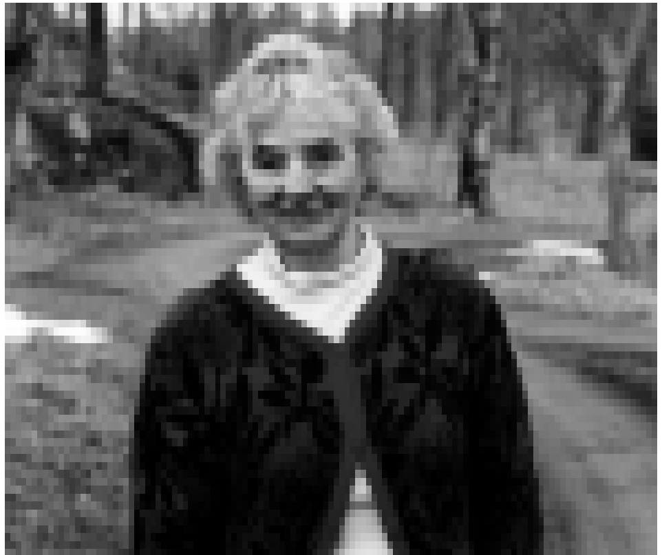
Författarinna Gerda Antti talar om seniorfrågor under rubriken "Vi som vet vad det handlar om".