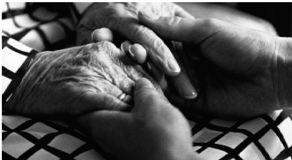
Livet som senior kan innebära små och stora problem som kan lösas med hjälp och stöd på olika sätt.