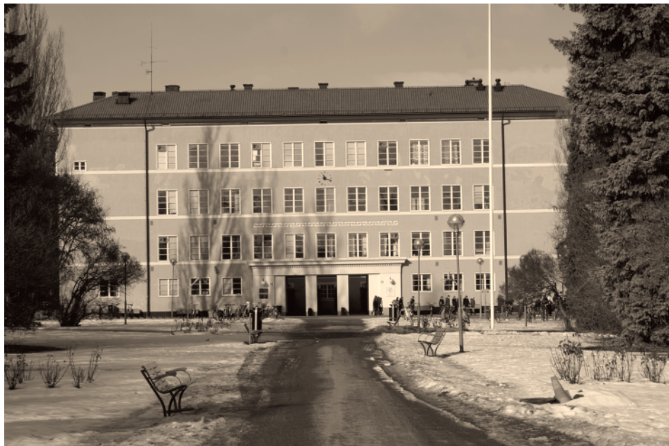
Friskolan Internationella Engelska Skolan i Linköping, med goda studieresultat, gästas medlemsmöte med Kristdemokraterna i Linköping onsdag 18 mars kl 18.00.