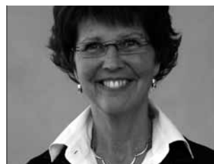
Yvonne Andersson Riksdagsledamot från Linköping

ATT STÖDJA DE 400 000 BARN som växer upp i missbrukarfamiljer är oerhört viktigt för att bygga ett bättre och mänskligare samhälle. Det stödet behöver också barnen i Europa. Därför ska vi driva kristdemokratisk politik i Sverige samtidigt som vi ska sprida våra ambitioner till EU-länderna. Gå och rösta på en av våra riktigt bra EU-kandidater till Europaparlamentet, så bidrar du inte enbart till barnens situation i Sverige utan också till spridning av den goda politiken till många andra länder