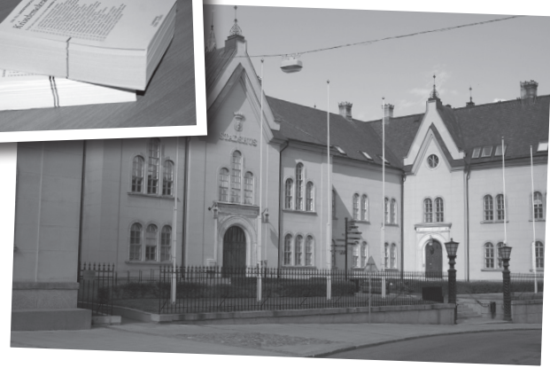
Ta chansen att påverka vilka kristdemokrater som ska ta plats i Linköpings stadshus 2014!