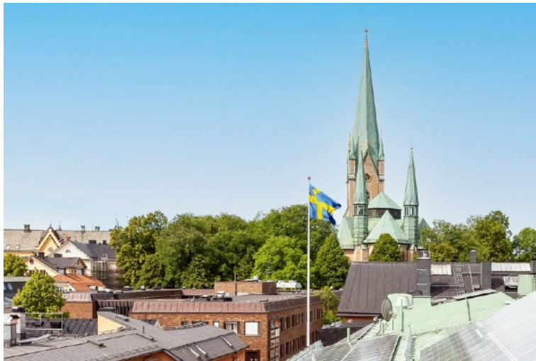
Bild: Vy över Linköping.