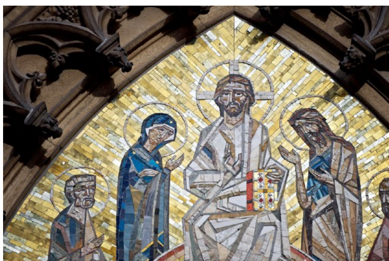
Bild: Domkyrkan, huvudingångens tympanon.