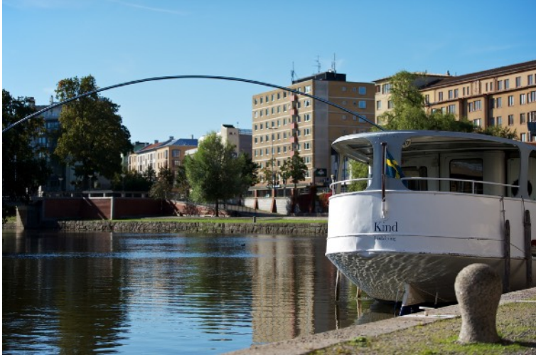
Bild: Drömmarnas båge, Stångån.