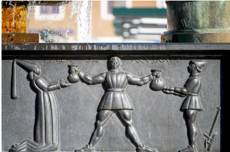
Bild: Folkungabrunnen på Stora Torget.