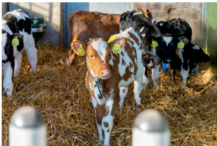
Bild: Kolstorps Gård utanför Ljungsbro.