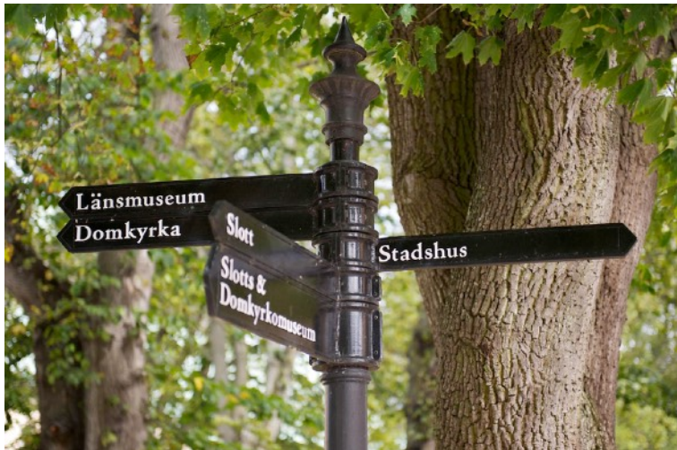
Bild: Skyltar i Domkyrkoparken.