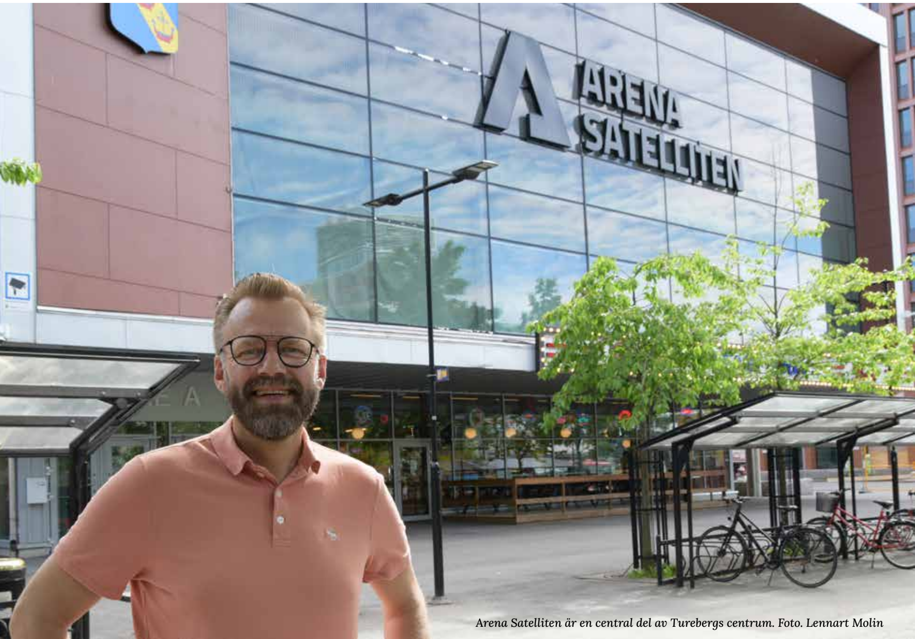
Arena Satelliten är en central del av Turebergs centrum.