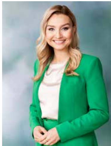
Ebba Busch, partiledare för Kristdemokraterna, står redo att tillsammans med Ulf Kristersson, partiledare för Moderaterna, bilda ny regering..

Ebba Busch, 35 år, står överst på riksdagslistan i Sollentuna. Hon är, med ditt stöd, redo för ett maktskifte.